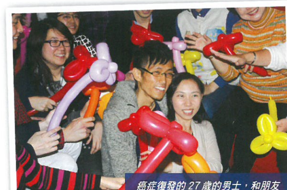
癌症復發的27歲的男士，和朋友

舉辦「最後派對之生前告別會」的另一個目的，就是臨終者邀請親朋相見、傾談、拍照等，令彼此都擁有珍貴的回憶，也減少親友因沒有機會見病者「最後一面」的遺憾。