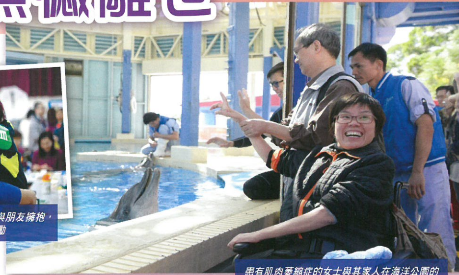
患有肌肉萎縮症的女士與其家人在海洋公園的安排下，近距離與海豚接觸，留下難忘一刻