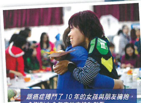
跟癌症搏鬥了10年的女孩與朋友擁抱，多謝對方多年來的支持和鼓勵

第三位參加者則是一位27歲的男士，他早於12歲時便已首次發現患上腸癌。雖然經治療後一度康復，並回復正常生活，可惜他在22歲時不幸癌症復發，情況嚴重，生命正走向盡頭。這計劃協助他舉行