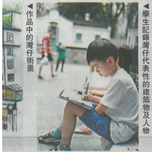
▲學生記錄灣仔代表性的建築物及人物