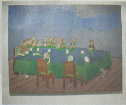
▲唐志岡畫作「世像：藍影之一」