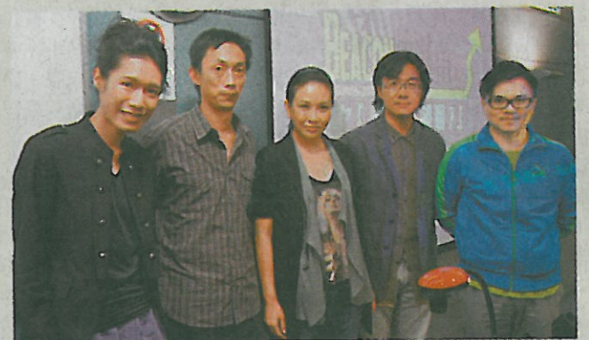
■調查指近17%的受訪學生，當愛情路上屢受挫折時，不排除自己會戀上同性。

Haut Brion Blanc，則各以6.875萬元成交。昨日的慈善拍賣環節共售出12件酒品，拍賣價連佣金共籌得約54萬元。善款將撥捐領賢慈善基金，以支持有關藝術、設計和音樂的教育和推廣工作，藉以提升香港地位。